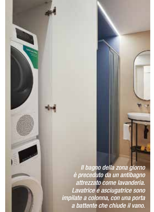
Il bagno della zona giorno è preceduto da un antibagno attrezzato come lavanderia. Lavatrice e asciugatrice sono impilate a colonna, con una porta a battente che chiude il vano.

Progetto di architettura e interior design: FD Architect , arch. Francesca Diano, Milano - www.francescadiano.com