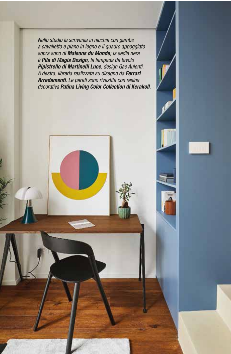
Nello studio la scrivania in nicchia con gambe a cavalletto e piano in legno e il quadro appoggiato sopra sono di Maisons du Monde ; la sedia nera è Pila di Magis Design , la lampada da tavolo Pipistrello di Martinelli Luce , design Gae Aulenti. A destra, libreria realizzata su disegno da Ferrari Arredamenti . Le pareti sono rivestite con resina decorativa Patina Living Color Collection di Kerakoll .

Nei diversi ambienti della casa è posato a terra un parquet in prefinito di rovere tinto: posate a correre, le grandi doghe piallate presentano una superficie ruvida e irregolare con nodi a vista. Per i gradoni della pedana, le pavimentazioni e le pareti di cucina e bagni le finiture sono in resina all'acqua con spessori di pochi millimetri. Gli effetti decorativi sono diversi sulle varie superfici: la posa manuale dà modo di ottenere, a seconda del prodotto utilizzato, texture stonalizzate lisce e vellutate, oppure increspature orizzontali o verticali, ruvide al tatto. È possibile attingere a un'ampissima gamma di colori.